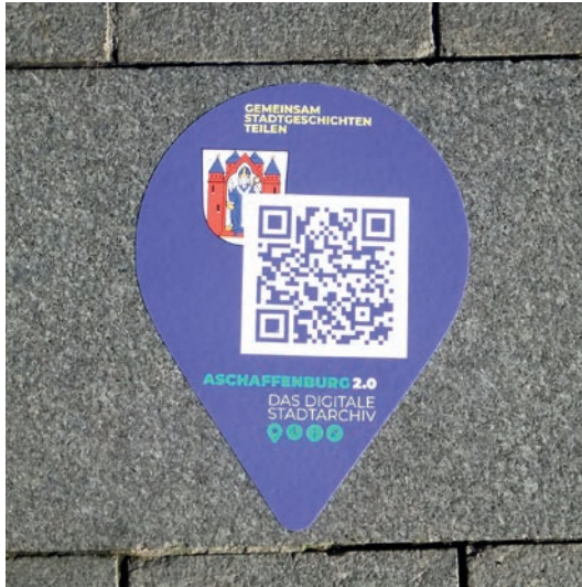
Abb. 9: Beispiel eines Bodenaufklebers (Standort Sandgasse, Aschaffenburg, 2021).

Die Nutzung der App sowie letztlich auch des Stadtlabors vor Ort, in der Stadt und ihren Stadtteilen, führt schließlich noch einmal zu analogen Werkzeugen: Über Bodenaufkleber, deren QR-Code direkt auf einen Stadtlabor-Beitrag verweist, macht das Stadtlabor-Team die partizipativen Beiträge prägnant sichtbar. In Ergänzung hierzu verweisen kleinformatige Aufkleber im Stil von Wanderrouten-Hinweisschildern auf die vollmobile Smartphone-App Aschaffener Geschichten . 29 Beide Angebote stehen durchaus sinnbildlich für den bereits dargestellten digital-analogen Ansatz.