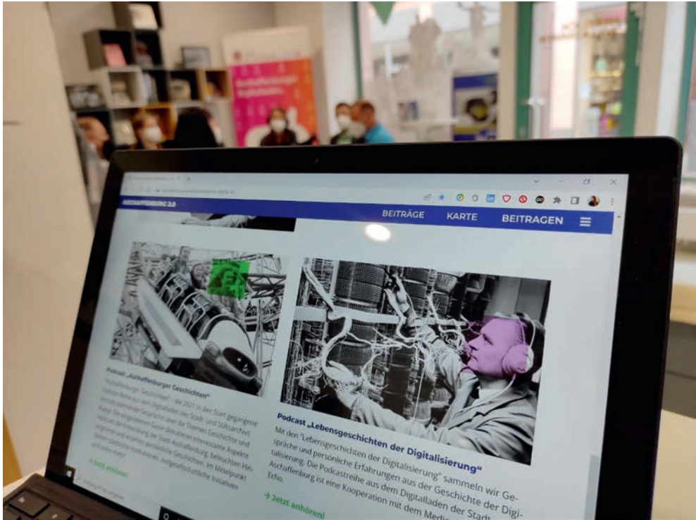
Abb. 6: Aufnahme eines Podcasts der „Lebensgeschichten der Digitalisierung“ (2022).

Computer Clubs 14 zu digitalen Problemen berät. Die Liste der involvierten Einrichtungen und Vereine ließe sich noch fortsetzen – von Coding-Workshops für Kinder und Jugendliche über Aktivitäten der Aschaffener Stadtbibliothek und des Stadtjugendrings bis hin zu abendlichen Meetings von Stadtratsfraktionen (zu digitalen Themen) und zu Treffen der Jugendauszubildendenvertretung. Auch der zuständige Koordinator des bereits genannten Forschungsprojekts zur Aschaffener Stadtgeschichte ist mit seiner Sprechstunde im Rahmen der Ladenöffnungszeiten sehr aktiv, und ebenso sind Sammlungsaufrufe zur jüngeren und jüngsten Vergangenheit der Stadt bereits mehrmals mit einigem Erfolg über den Digitalladen lanciert worden.