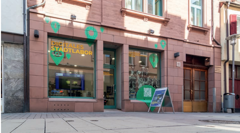
Abb. 1: Der Digitalladen, 2021.

fächern und kleiner Garderobe, eine Sitzgruppe für Gespräche und weitere Sitzmöglichkeiten um einen großen Tisch herum; der Tisch dient unter anderem für die Aufnahme von Podcast-Formaten, die im Digitalladen von Beginn an aufgezeichnet werden – hierzu unten mehr. Zur weiteren Ausstattung zählen auch ein digitales Whiteboard, eine mobile Scanvorrichtung ( Scantent ) sowie ein großformatiger Bildschirm für das Schaufenster. 2