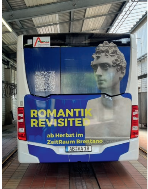
Abb. 7: Key Visual des Projekts „Zeit-Raum Brentano“, zugleich Buswerbung im 2. Halbjahr 2022.

Auch die digitale Nacherfassung der umfassenden Aschaffenburgs Denkmaltopographie 20 ist mittlerweile als eigenes Projekt ( Denkmaltopographie digital ) im Stadtlabor verfügbar – und zugleich in die Gesamtkarte der Stadtlabor-Beiträge eingeflossen. 21 Die Ergebnisse der beiden neuen Projekte ZeitRaum Brentano und Dialog Romantik , die im Jahr 2022 durch Projektteams unter Federführung des Stadt- und Stiftsarchivs Aschaffenburg bearbeitet werden, sollen ebenso zukünftig über die Stadtlabor-Seite zugänglich gemacht werden; es handelt sich um Vorhaben, die der digitalen Vermittlung der Epoche der Romantik und der für Aschaffenburg wichtigen Familie Brentano über virtuelle (Meta-)Räume dienen. 22