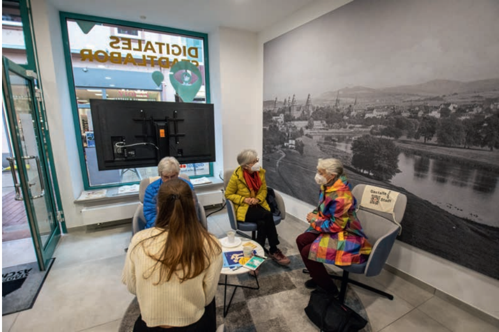
Abb. 3: Vorderer Bereich Digitalladen (Meeting 1 Jahr Digitalladen, April 2022).

jekte vor den Medien erfolgt unter anderem im Besprechungsraum. So wird der Digitalladen zu einer Schnittstelle des analogen und digitalen Zusammenarbeitens. Verschiedene Akteur*innen, ob Einzelpersonen oder Gruppen, lernen sich hier kennen und entwickeln gemeinsame Projekte.